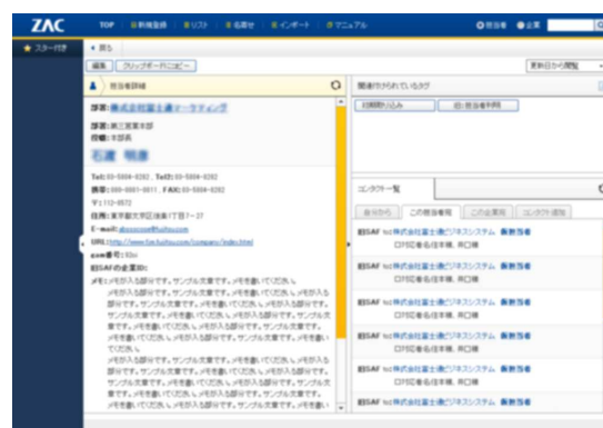
「コンタクト管理」画面イメージ