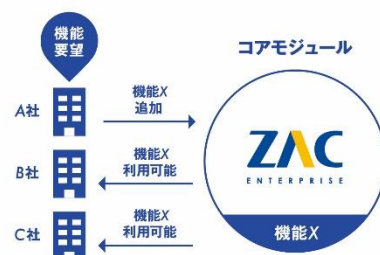
パラメータ設計のイメージ

「ZAC Enterprise」はユーザー企業個々の要望に対して、パッケージ内部のパラメータを設定することにより機能適合するため、個別開発を必要とする従来システムに比べ、低コスト・短期間での ERP 導入を実現しています。パラメータはユーザーの要望を反映し日々追加されるため、常に成長・進化を続ける設計となっています。