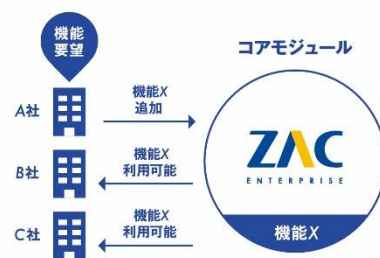
パラメータ設計のイメージ

「ZAC Enterprise」はユーザー企業個々の要望に対して、パッケージ内部のパラメータを設定することにより機能適合するため、個別開発を必要とする従来システムに比べ、低コスト・短期間での ERP 導入を実現しています。パラメータはユーザーの要望を反映し日々追加されるため、常に成長・進化を続ける設計となっています。