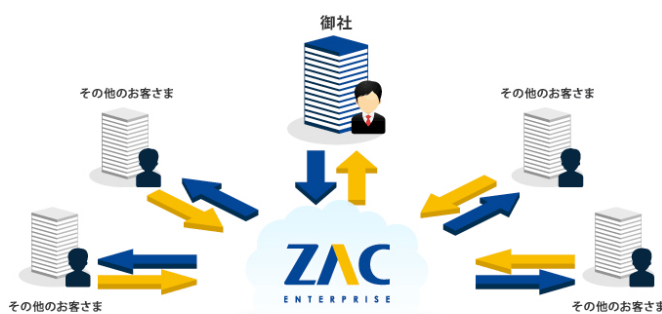
ZAC Enterprise の利用イメージ

クラウド・SaaS 型によるサービスの提供により、サーバー等のシステム導入に伴う各種設備投資が不要となります。日々のデータのバックアップやメンテナンスなどの保守・運用はオロのデータセンターで管理されるため、運用にかかる固定費・人件費の削減と、災害など有事の際の対策を実現します。